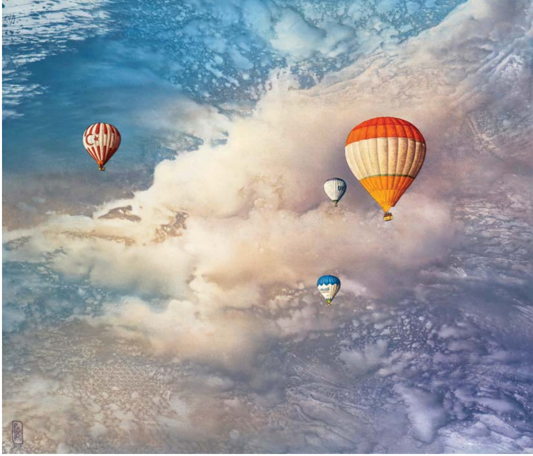
Riccardo Ruberti, I silenzi degli spazi infiniti , tempera e olio su tela, cm 60 x 80