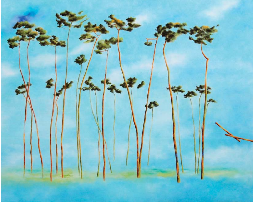
Riccardo Corti, Pensami , olio su tela, cm 105 x 130