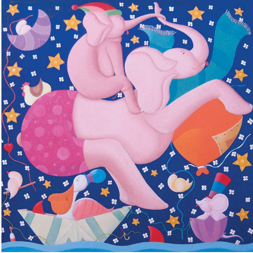
Beppe Francesconi, I buoni ricordi , olio su tela, cm 80 x 80