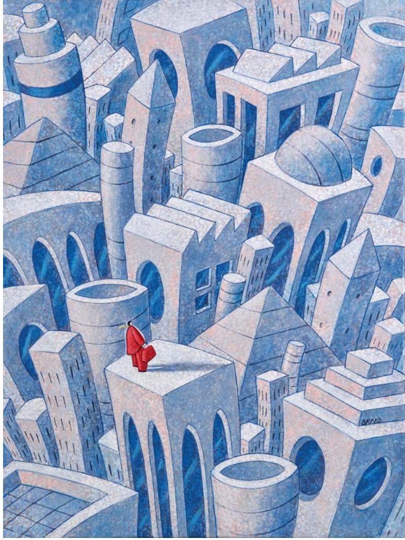
Armando Orfeo, L'oplite , acrilico e olio su tela, cm 80 x 60