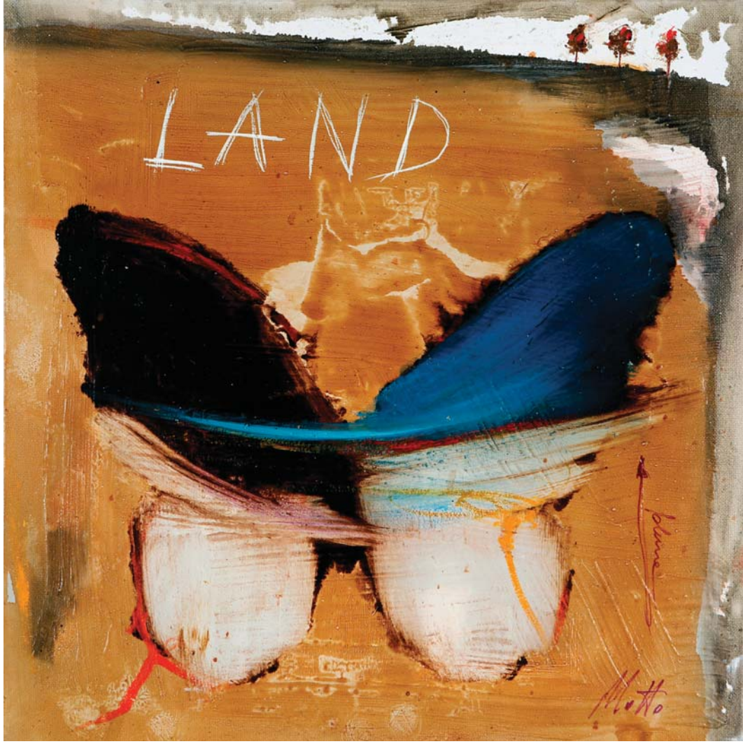
Gianluca Motto, Verso l'ignoto, tecnica mista su tela, cm 30 x 30