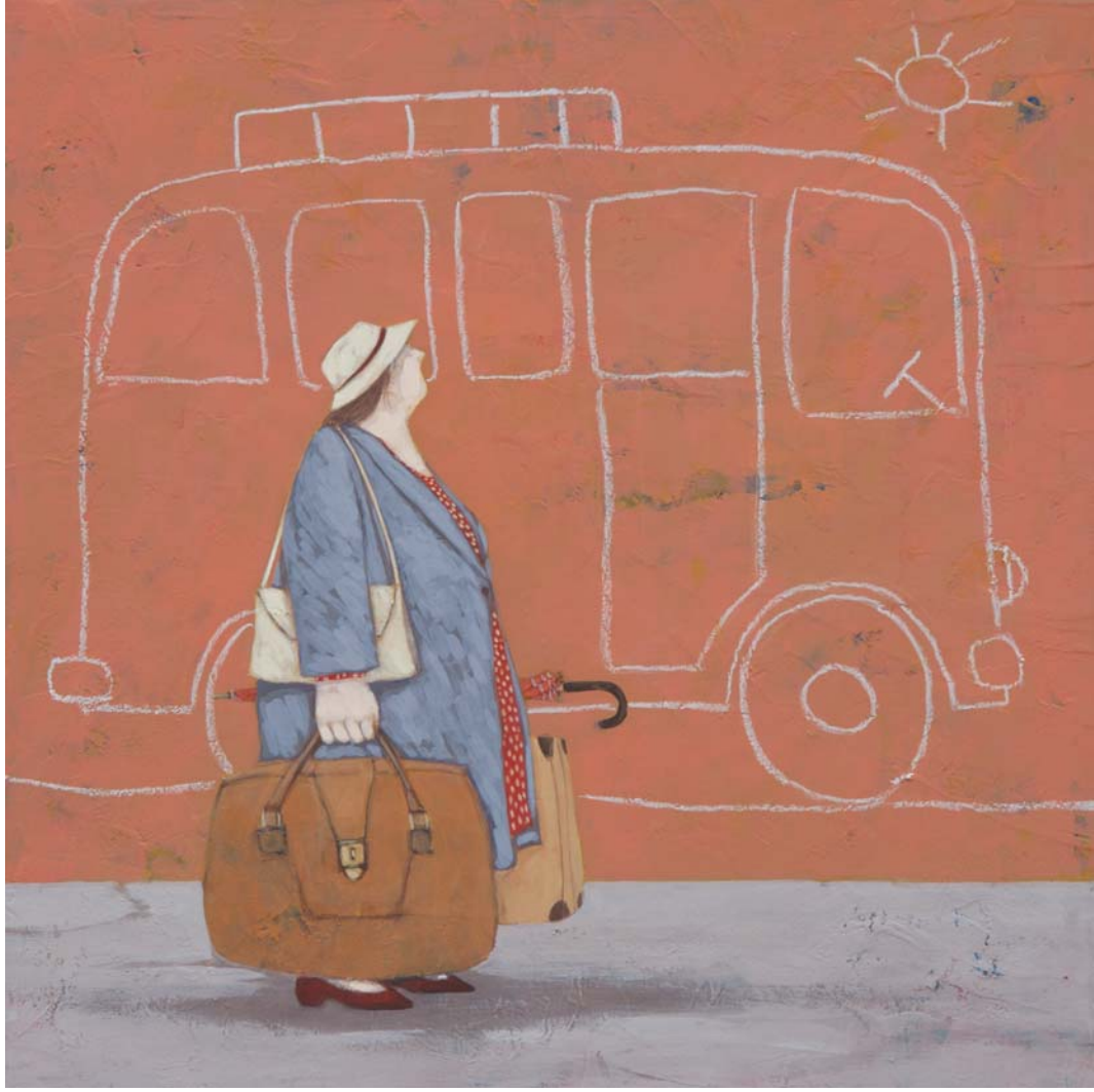
Lisandro Rota, La corriera , acrilico su tela, cm 50 x 50