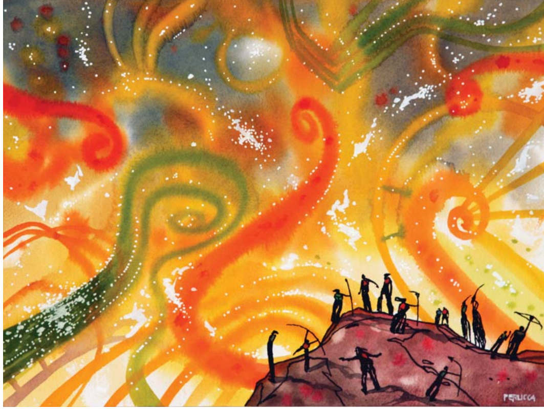
Nicola Perucca, Nuove formazioni , tecnica mista su carta, cm 30 x 40