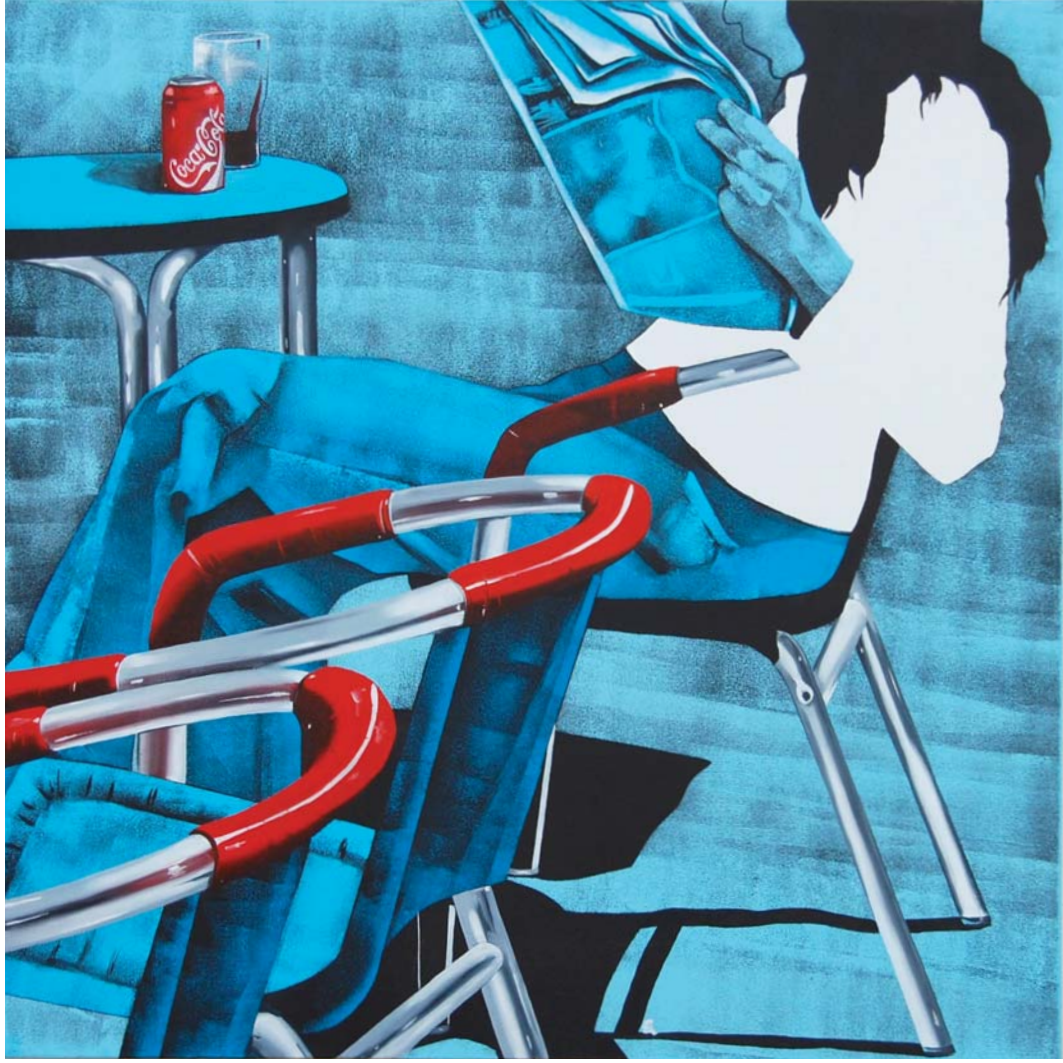
Daniela Caciagli, Coca-cola , acrilico e olio su tela, cm 70 x 70