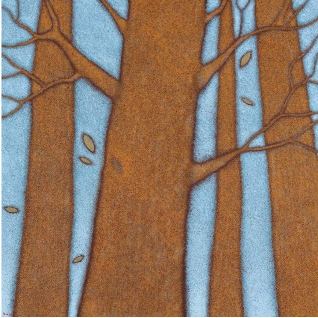
Guido Morelli, Alberi con foglie cadenti , olio su tela, cm 80 x 80