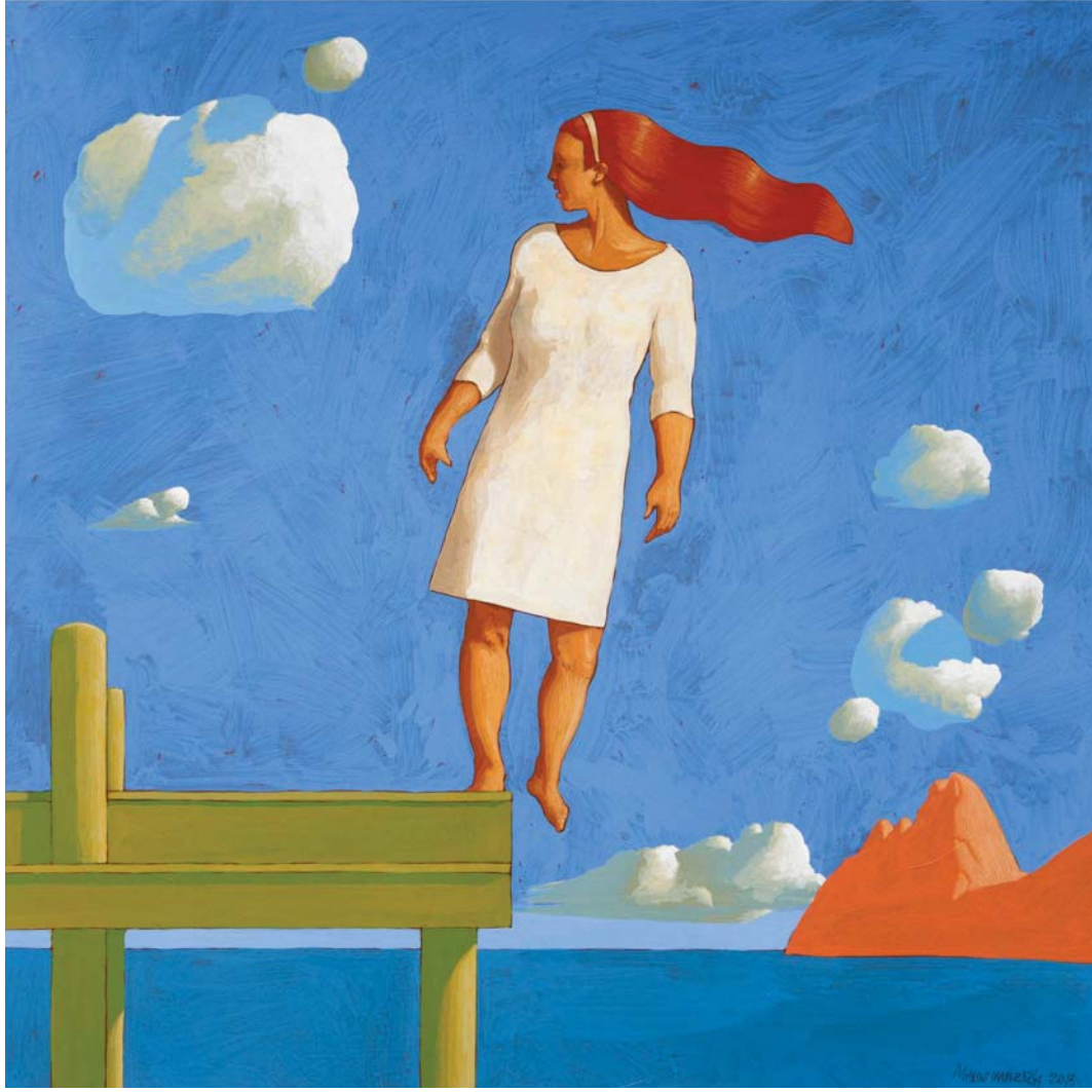
Marco Manzella, Pontile VIII , tempera su tavola, cm 60 x 60