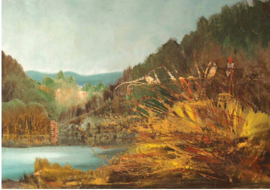
Annamaria Buonamici, Vibrazioni , olio su vetroresina, cm 60 x 100