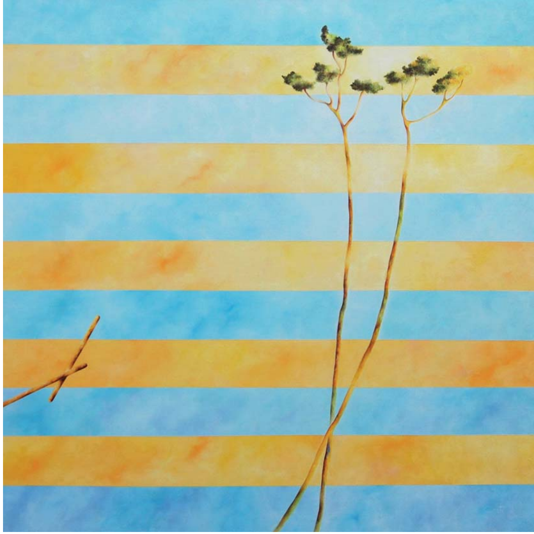
Riccardo Corti, E poi il mare , olio su tela, cm 100 x 100