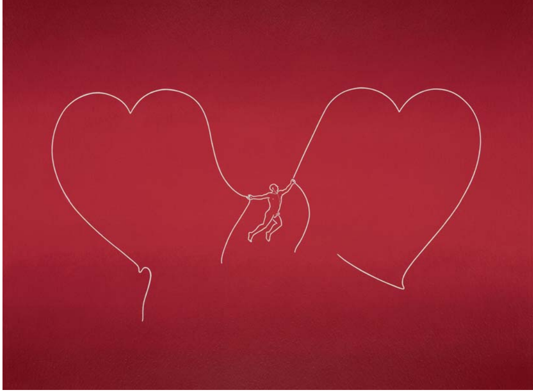
Valente Taddei, Amorino , olio e china su carta, cm 56 x 76