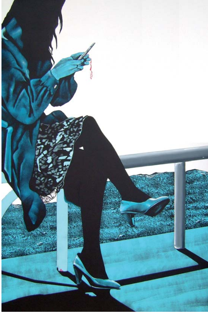
Daniela Caciagli, Mai più messaggi in bottiglia , acrilico e olio su tela, cm 120 x 80