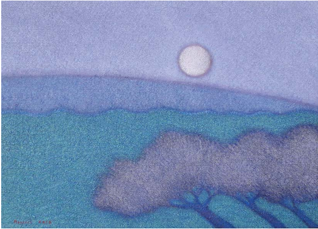
Guido Morelli, Notturmo sul fiume , olio su tela, cm 50 x 70