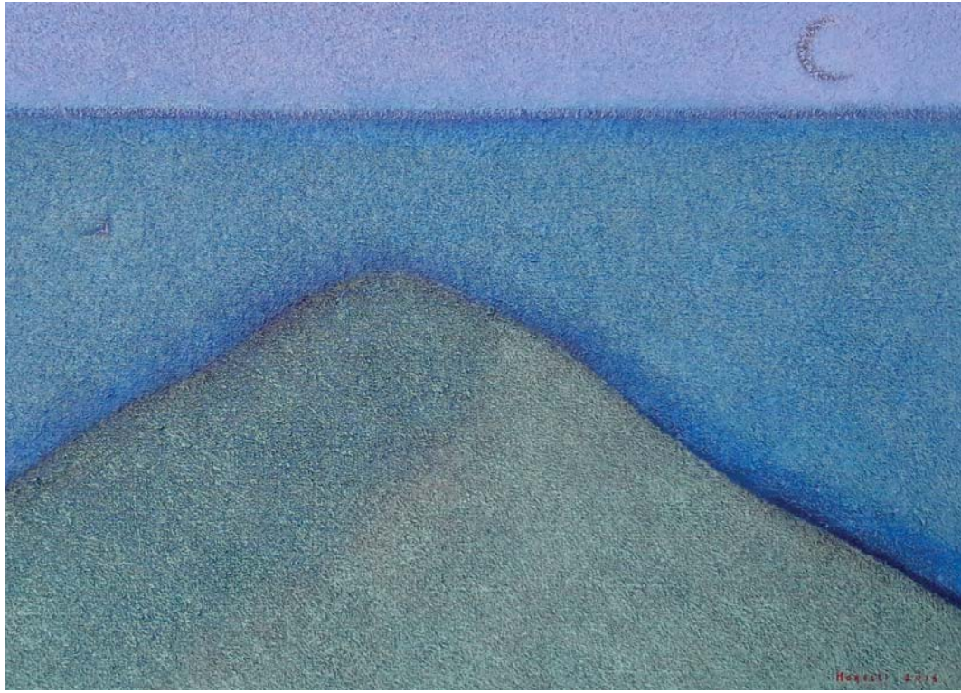
Guido Morelli, Notturmo sul mare , olio su tela, cm 50 x 70