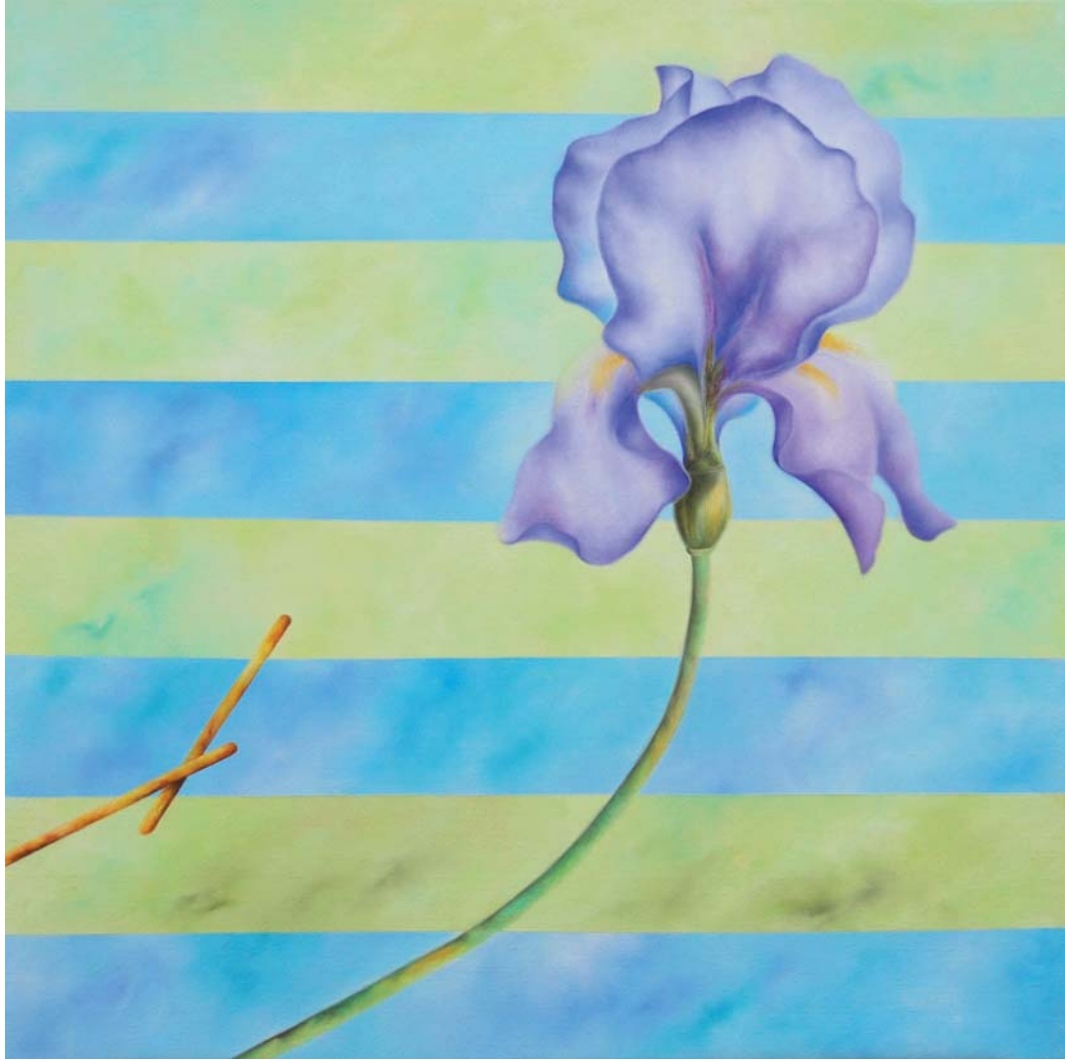
Riccardo Corti, Florence , olio su tela, cm 70 x 70