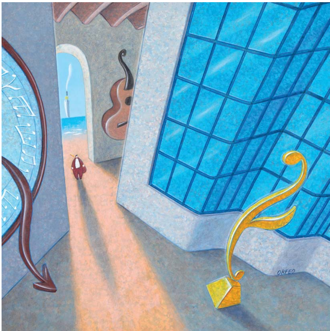
Armando Orfeo, Barcellona , acrilico e olio su tela, cm 60 x 60