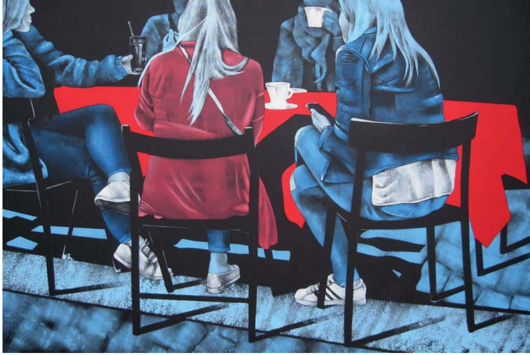
Daniela Caciagli, Tovoglie rosse 2 , acrilico su tela, cm 80 x 120