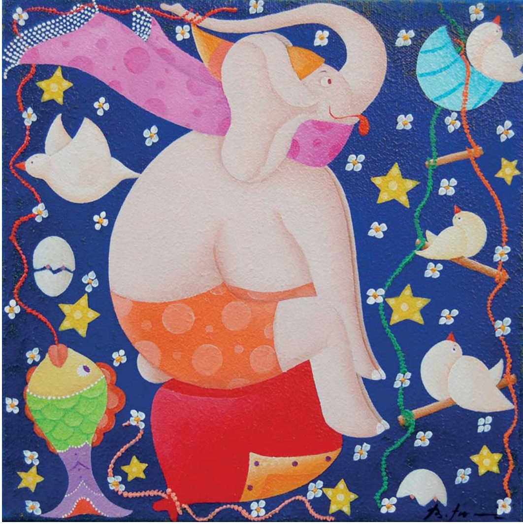
Beppe Francesconi, Succede di sentirsi bene , olio su tela, cm 30 x 30