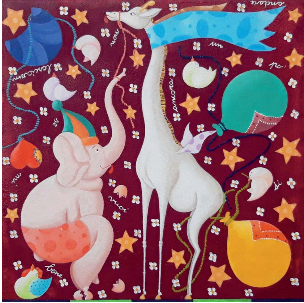
Beppe Francesconi, Non lasciarmi andare, olio su tela, cm 40 x 40